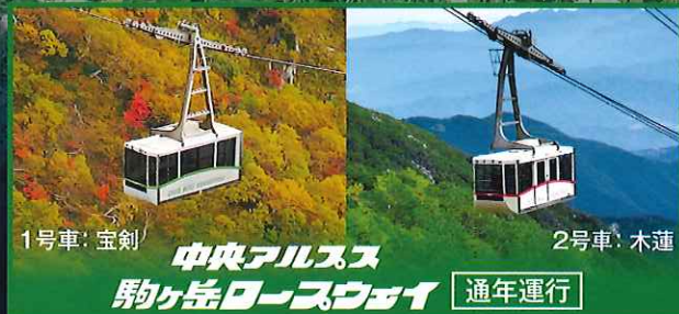
1号車: 宝剣 中央アルプス 駒ヶ岳ロープウェイ 2号車: 木蓮 通年運行

中央アルプス駒ヶ岳ロープウェイで行く標高2,612mの千畳敷は、今から約2万年前に、氷河により浸食されて形成されたカール(半円形の窪地)で、畳を1,000枚敷いた広さがあることから「千畳敷カール」と呼ばれています。夏の高山植物、秋の紅葉、冬の紺碧の空と雪景色など四季折々に魅力的な表情を見せてくれます。